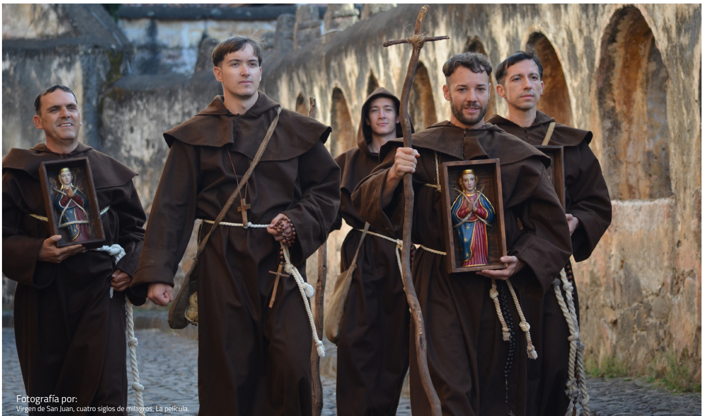
Fotografía por: Virgen de San Juan, cuatro siglos de milagros, La película.