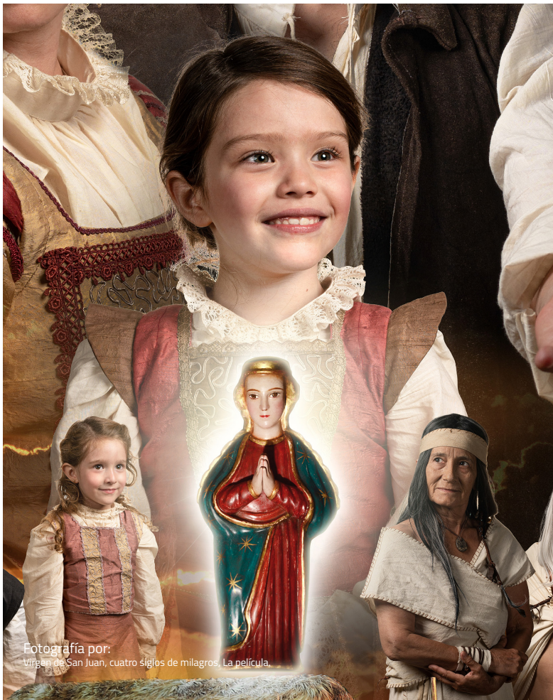
Fotografía por: Virgen de San Juan, cuatro siglos de milagros. La película.

Por Pbro. Cango. Jaime Gutiérrez Gutiérrez.